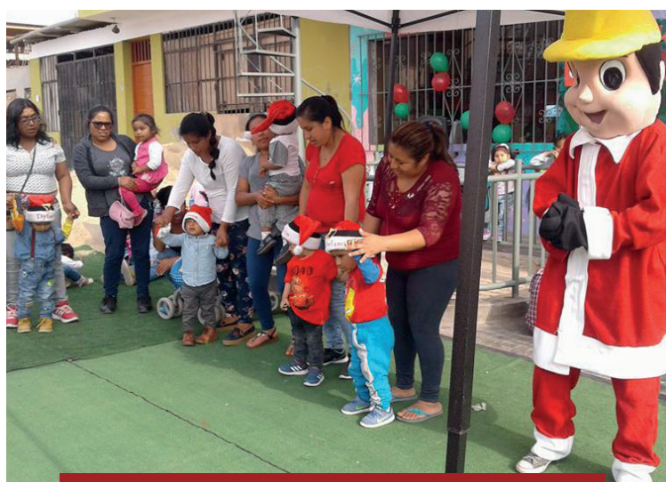
Madres e hijos del proyecto Estimulación Temprana - Caminadores

La clausura se llevó a cabo el día 1 de diciembre en Casa Haug. Asistieron los beneficiarios de los proyectos para la entrega de diplomas, la presentación de las canciones navideñas y la chocolatada. Este evento sirvió para que los beneficiarios de nuestra comunidad se relacionen y compartan sus experiencias en cada uno de los proyectos.