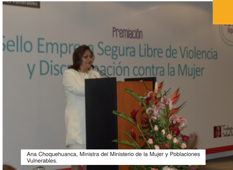
Ana Choquehuanca, Ministra del Ministerio de la Mujer y Poblaciones Vulnerables.

contra la mujer. Fuimos evaluados y cumplimos los requisitos en cuanto a acatamiento de disposiciones legales (licencias de maternidad y paternidad, reglamento interno de prevención y sanción del hostigamiento sexual, derecho a lactancia: hora de lactancia, implementación de lactario, entre otros), cultura organizacional (políticas y procedimientos que promueven la igualdad de género en la empresa, otros), práctica cotidiana (promoción de una cultura de paz, procedimiento para abordar casos de violencia, acciones de conciliación entre la vida familiar y laboral) y trabajo con y hacia la comunidad (proyecto de empoderamiento social y económico de las mujeres de la comunidad de Lurín, actividades de prevención de la violencia contra las mujeres y promoción de la igualdad de género).