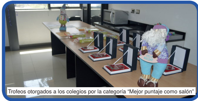
Trofeos otorgados a los colegios por la categoría "Mejor puntaje como salón"

Las evaluaciones nos han mostrado que los alumnos tienen el impulso para superarse año a año, es por ello que debemos reafirmar nuestro compromiso con la comunidad para ser los agentes de cambio que promuevan junto a nuestros aliados, una cultura de respeto, convivencia y civismo en nuestros vecinos más jóvenes.