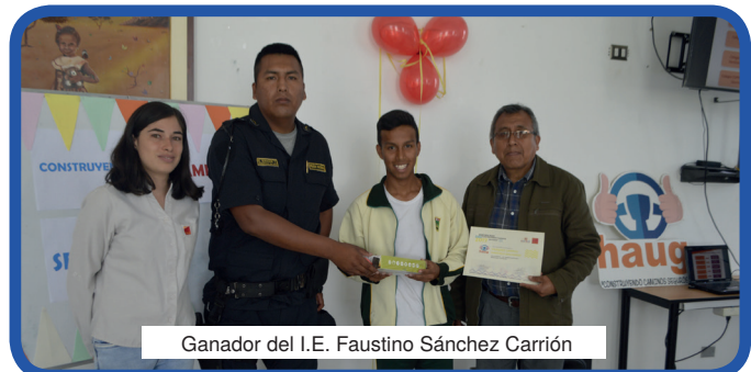
Ganador del I.E. Faustino Sánchez Carrión