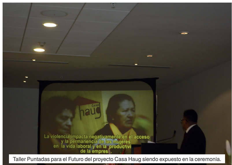
Taller Puntadas para el Futuro del proyecto Casa Haug siendo expuesto en la ceremonia.