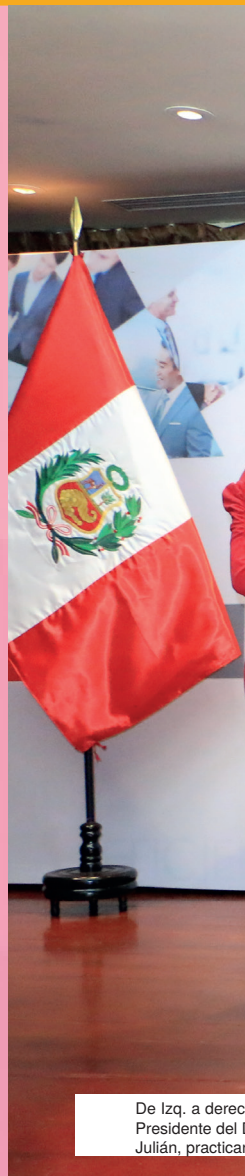
De Izq. a derec Presidente del Julían, practica