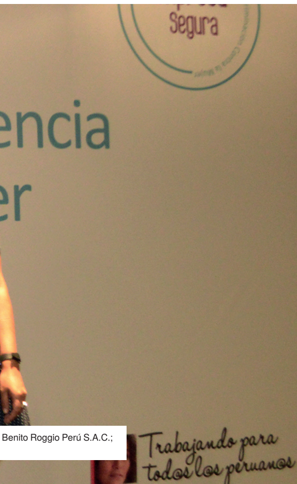
Benito Roggio Perú S.A.C.;