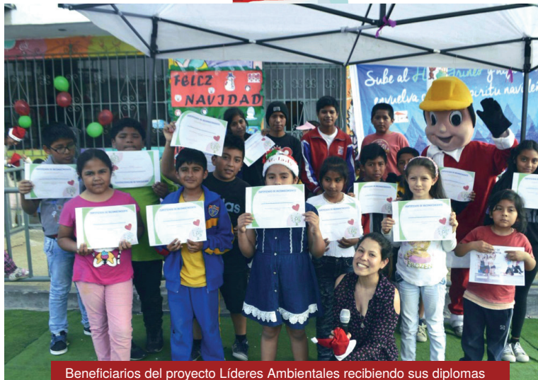
Beneficiarios del proyecto Líderes Ambientales recibiendo sus diplomas