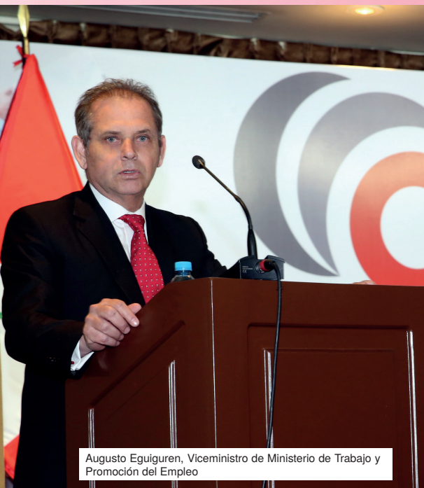
Augusto Eguiguren, Viceministro de Ministerio de Trabajo y Promoción del Empleo

Se realizaron estratégicamente actividades preventivas como activaciones directas y comunicacionales, con la intervención del proyecto Puntadas para el Futuro. Contamos también con políticas y procedimientos que promueven y aseguran una cultura de igualdad de género en la empresa. Asimismo, la habilitación de espacios que promuevan una relación armónica y de respeto entre hombres y mujeres de HAUG, a su vez, que brinden las comodidades necesarias para que las mujeres se desarrollen en un ambiente de igualdad. De esta manera, se busca lograr un espacio seguro para laborar óptimamente.