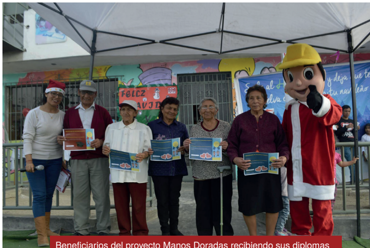
Beneficiarios del proyecto Manos Doradas recibiendo sus diplomas